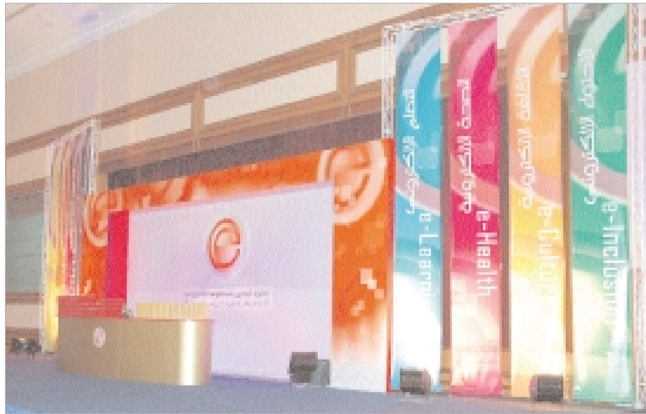
مسرح الجائزة المميز الذي أضيف للحدث اجواء عالمية